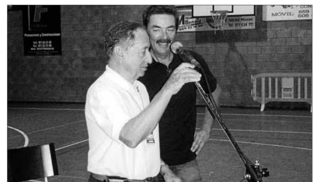
Fernández es retrobà amb el mític pilot Buttenhoff.