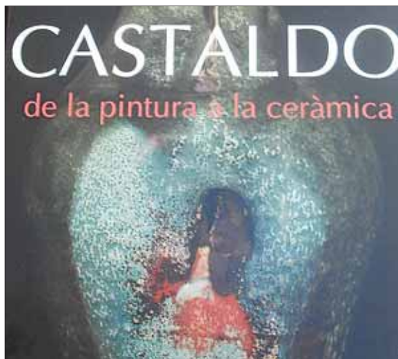
Portada del llibre "El catàleg" i a la dreta una imatge de l'artista solleric al seu taller.

fer al Palacio de Cristal de Madrid, "Dotze ceramistes espanyols". Al costat de Ll. Castaldo exposaren